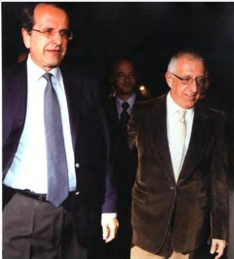
«Το σημαντικότερο που είπα στον Σαμαρά: "Πρέπει να δεις τον Σαρκοζί". Με ρώτησε "γιατί;" και απάντησα: "Γιατί πρέπει να τον αντιγράψουμε", δηλώνει στο CRASH ο Ν. Κακλαμάνης.

Του θυμίζω πράγματα πολύ παλαιότερα, προ 20 ετών, όταν δηλαδή οι επονομασθέντες «λοχαγοί του Καραμανλή», με προτροπή και πρωτοβουλία Βαρυβιτσιώτη, όπως λέγεται, του... ανασκοίνωσαν μέσα στο γραφείο του, στην οδό Πλουτάρχου, ότι... αποφάσισαν να τον εκλέξουν αρχηγό της Νέας Δημοκρατίας. Έδειξε έκπληξη και απροθυμία. Τους είπε