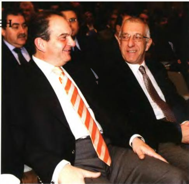
«Τι ευθύνη έχει ο Καραμανλής που πλήρωσε τη "μαύρη τρύπα" του κ. Σημίτη και ο κ. Γεωργίου τη συμπεριέλαβε στον "λογαριασμό" της ΕΛΣΤΑΤ για να "βρουν πάτημα" οι Ευρωπαίοι να ξεκινήσουν τα μνημόνια επί ΓΑΠ;» αναρωτιέται ο Νικήτας Κακλαμάνης.

Ό,τι και να ισχυρίζονται στην κυβέρνηση, τα γεγονότα «μιλούν» από μόνα τους. Ο κόσμος πλέον φοβάται να κυκλοφορεί στους δρόμους. Η Αθήνα, μόλις νυχτώνει, μετατρέπεται σε έρημη πόλη. Στα Εξάρχεια, που αναφέρατε, για πρώτη φορά μετά από δεκαετίες ξεσηκώθηκαν και οι κάτοικοι. Οι «μπαχαλάκηδες» και οι συμμορίες τα έχουν μετατρέψει σε «άβατο», ενώ με τα στοιχεία που έρχονται καθημερινά στην επιφάνεια αποδεικνύεται ότι κάνουν «δουλειές με φούντες». Ο «Ρουβίκωνας» κάνει «πάρτι» μπαλονοβγαίνοντας στις πρεσβείες και τρομοκράτες καταδικασμένους 11 φορές σε ισόβια «κόβουν βόλτες» στο Κολωνάκι! Απίστευτα πράγματα, που δεν έχουν συμβεί ξανά στην Ελλάδα. Όλα αυτά είναι το αποτέλεσμα της κυβερνητικής πολιτικής για τη δημόσια τάξη. Διάλυση παντού. Υπάρχει πιο χαρακτηριστικό παράδειγμα από