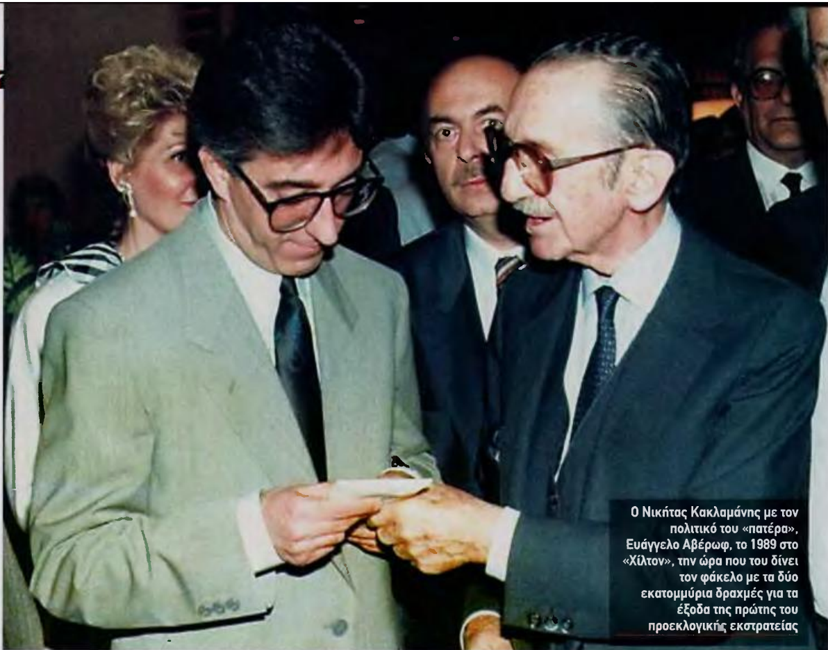
Ο Νικήτας Κακλαμάνης με τον πολιτικό του «πατέρα», Ευάγγελο Αβέρωφ, το 1989 στο «Χίλτον», την ώρα που του δίνει τον φάκελο με τα δύο εκατομμύρια δραχμές για τα έξοδα της πρώτης του προεκλογικής εκστρατείας

►► Ο Νικήτας Κακλαμάνης αναπολεί το παρελθόν και εξομολογείται στο Crash ότι η πολιτική του σταδιοδρομία ξεκίνησε από ένα «φακελάκι» που είχε μέσα δύο εκατομμύρια δραχμές. Δεν πήρε το «φακελάκι» ως γιαστρός. Του το έδωσε το 1989 ο Αβέρωφ για τα έξοδα της πρώτης του προεκλογικής εκστρατείας. Χαρακτηρίζει τον Κώστα Καραμανλή διαχρονική «εγγύηση της ιδεολογίας και της ενότητας της παράταξης» και υποστηρίζει πως «ανετράπη» για τα «ΟΧΙ» που είπε στα εθνικά θέματα και τις επαφές με τη Ρωσία για τους υδρογονάνθρακες στο Καστελόριζο. Δηλώνει πως δεν μετανιώνει που ακολούθησε τον Αντώνη Σαμαρά το 1993 στην Πολιτική Άνοιξη και αιτιολογεί την επιλογή του «κυρίως για τις θέσεις του στα εθνικά θέματα». Απευθύνεται στην κυβέρνηση και λέει για το φορολογικό νομοσχέδιο πως στην πρώτη του εκδοχή «είναι σαν να το έγγραψαν άνθρωποι που ζουν σε μίαν άλλη χώρα και να το έστειλαν εδώ με e-mail».