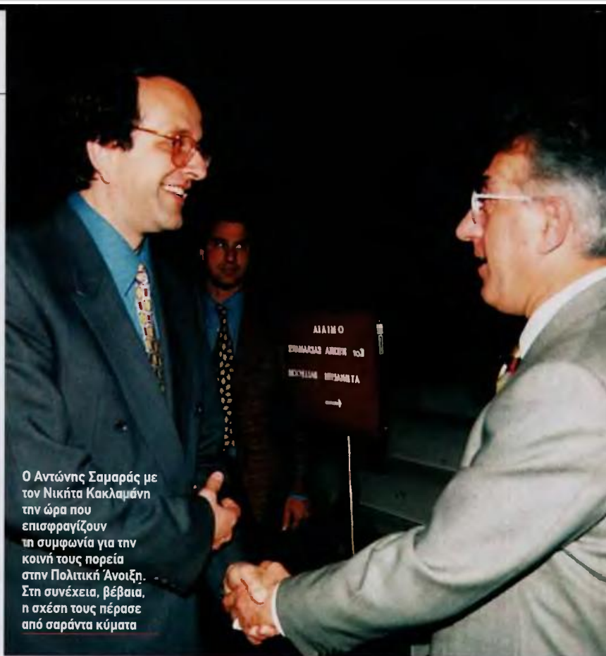
Ο Αντώνης Σαμαράς με τον Νικήτα Κακλαμάνη την ώρα που επισφραγίζουν τη συμφωνία για την κοινή τους πορεία στην Πολιτική Άνοιξη. Στη συνέχεια, βέβαια, η σχέση τους πέρασε από σαράντα κύματα

Δηλώνεις ότι ο Κώστας Καραμανλής αποτελεί μεγάλο πολιτικό κεφάλαιο για τη χώρα. Πιστεύεις ότι θα μπορούσε να επανακάμψει στο ηπδόλιο της Κεντροδεξιάς; «Πάρα πολλοί "αυτοβαπτίζονται" εκπρόσω-