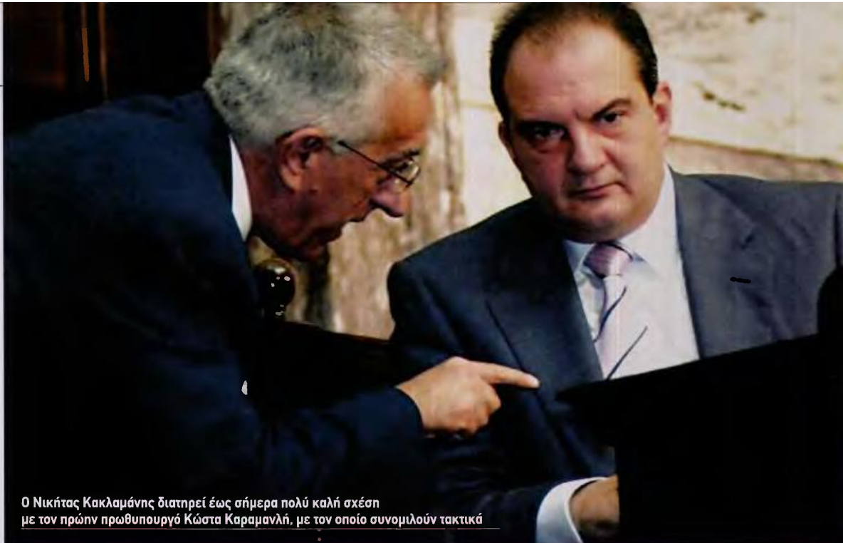
Ο Νικήτας Κακλαμάνης διατηρεί έως σήμερα πολύ καλή σχέση με τον πρώην πρωθυπουργό Κώστα Καραμανλή, με τον οποίο συνομιλούν τακτικά

ξελιχθούμε σε ένα σοβαρό κόμμα – δεν υπήρχε. Γιώργο, σοβαρή εναλλακτική πρόταση και λύση. Ο ΣΥΡΙΖΑ εκείνης της εποχής, με αυτά που έλεγε διά του αρχηγού του, ήταν εκτός τόπου και χρόνου και αυτό ήταν εξαιρετικά επικίνδυνο για τον τόπο».